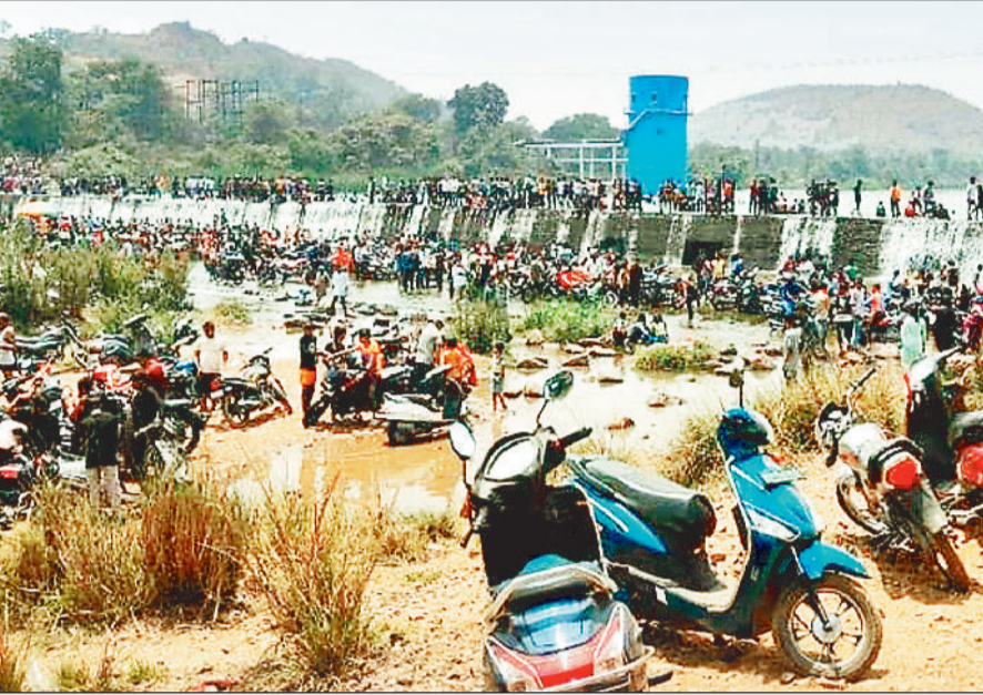
हरिभूमि न्यूज ►► रायगढ़

शहर में बढ़ती हुई गर्मी से राहत पाने एक बार फिर से पचधारी में लोगों की भारी भीड़ जुटना शुरू हो चुका है। जिससे इस जगह में छेड़छाड़ मारपीट को घटनाएं भी प्रतिदिन घटित हो रहा है।