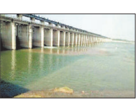
जलाशय में पानी भरने से निर्माण हुआ मुदिकल

रायगढ़। राष्ट्रीय राजमार्ग विभाग ने रायगढ़ से सारंगढ़ सराईपाली रोड को अधर में फंसा दिया है। सड़क का काम तो जैसे जैसे पूरा कर लिया जाएगा लेकिन महानदी में बनने वाले पुल का काम शायद ही पूरा हो। इस साल भी काम का सीजन खत्म होने को है लेकिन नवीन काम करने कोई सूचना नहीं है।